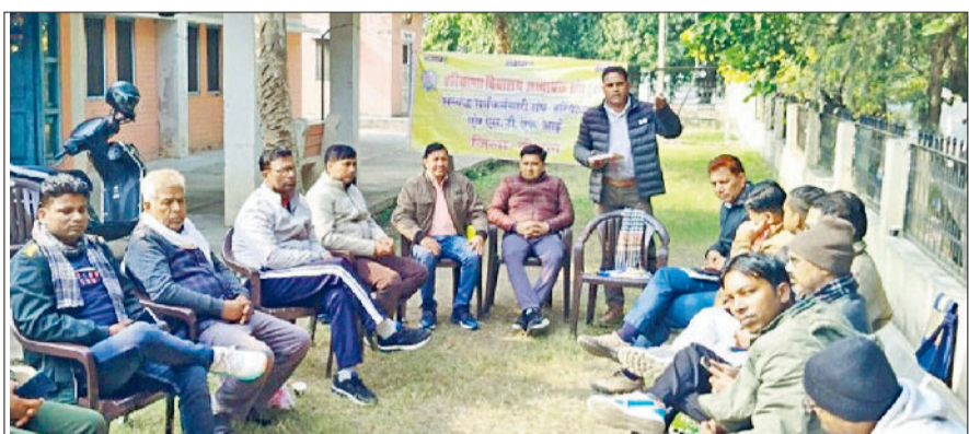
कैथल। बैठक के दौरान विचार-विमर्श करते कर्मचारी।