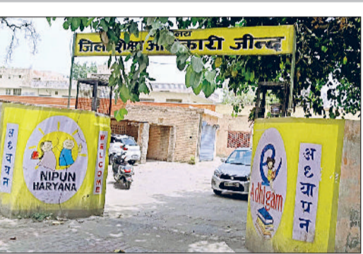
जींद। जिला शिक्षा अधिकारी कार्यालय।

हरिभूमि न्यूज जींद जिले में बुनियाद लेवल 1 की परीक्षा परिणाम के बाद बुनियाद लेवल 2 परीक्षा की 30 जनवरी को होगी। परीक्षा को लेकर जिले भर में पांच परीक्षा केंद्र बनाए गए हैं। पिछले दिनों जारी हुए परीक्षा परिणाम में जिले के 1343 विद्यार्थियों का चयन लेवल 2 के लिए हुआ है। विद्यार्थियों के परीक्षा केंद्र पर रिपोर्टिंग का समय दोपहर साढ़े 12 बजे तक रहेगा। वहीं परीक्षा दोपहर बाद एक बजकर 30 मिनट से लेकर पाँच बजे तक होगी। परीक्षा के समय विद्यार्थियों के आधार कार्ड और एडमिट कार्ड की जांच की जाएगी। खंड शिक्षा अधिकारी परीक्षा के समय केंद्रों का निरीक्षण करेंगे। वहीं जिला विज्ञान को परीक्षा का नोडल अधिकारी बनाया गया है। जिले में सात ब्लॉक हैं। गौरतलब है कि 26 दिसंबर को 13 केंद्रों पर मिशन बुनियाद के तहत लेवल 1 की परीक्षा हुई थी। परीक्षा के लिए जिले भर से 4548 विद्यार्थियों ने आवेदन किया था।