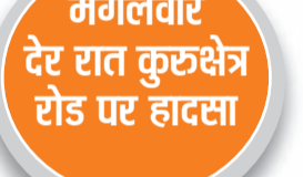
हरिभूमि न्यूज कैथल

एक ही परिवार के तीन सदस्यों की मौके पर ही मौत