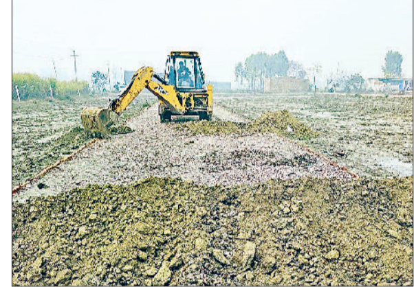
कैथल। अवैध कालोनी की सड़कों को हटाती जेसीबी।

द्वारिका गंभीर रूप से घायल हो गया। मौके पर मौजूद लोगों और पुलिस ने उसे बाहर निकालने का प्रयास किया लेकिन तब तक मौत हो चुकी थी। वहीं ट्रक में सवार परिचालक गंभीर रूप से घायल हो गया। जिसे एंगुलस की सहायता से जींद के सामान्य अस्पताल में भर्ती कराया है। जहां इलाज जारी है। सूचना मिलने पर जुलाना पुलिस ने मौके पर पहुंच कर शव को कब्जे में लिया और पोस्टमार्टम के लिए जींद के सामान्य अस्पताल भेजा।