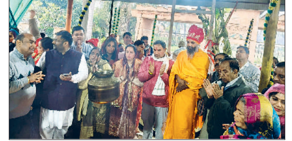
पूंडरी। फतेहपुर में यज्ञ में पूर्णाहुति आहुति डालते श्रद्धालु।

फतेहपुर स्थित माता मनसा देवी मंदिर परिसर में गुप्त नवरात्रि के पावन अवसर पर आयोजित शत चंडी महायज्ञ की विधिवत रूप से पूर्णाहुति संपन्न हुई। महायज्ञ क्षेत्र में सुख-शांति, समृद्धि, भाईचारे एवं जनकल्याण की कामना को लेकर आयोजित किया गया, जिसमें बड़ी