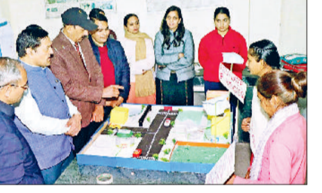
जीद। विज्ञान प्रदर्शनी का अवलोकन करते हुए।