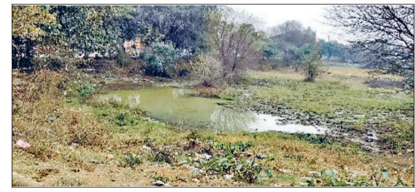
जींद। सेक्टर में खुले में दूषित पानी।