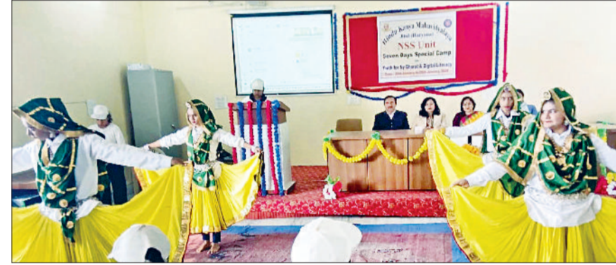
जीद। एनएसएस शिविर के समापन पर हरियाणवी नृत्य की प्रस्तुति देते हुए छात्राएं।

संदेशवाहक के रूप में कार्य कर समाज की रूपरेखा बदलने में महत्वपूर्ण भूमिका निभा सकती हैं। एनएसएस कार्यक्रम अधिकारी क्रांति ने पिछले छह दिनों में हर सत्र में करवाई गई विभिन्न गतिविधियों की अंतिम रिपोर्ट पढ़ी। विस्तार से बताया कि कैसे प्रत्येक गतिविधि स्वयंसेविकाओं के व्यक्तित्व विकास और समग्र वृद्धि से जुड़ी है और इसका कितना महत्व है। उन्होंने यह भी बताया कि 48 स्वयंसेविका प्रतिभागियों के लिए शिविर के उद्देश्य किस प्रकार प्राप्त हुए और इसके परिणाम भी स्पष्ट रूप से दिखाई दिए। इस दौरान स्वयंसेविकाओं ने हरियाणा राज्य