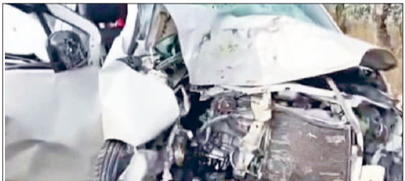
हादसे में क्षतिग्रस्त कार।