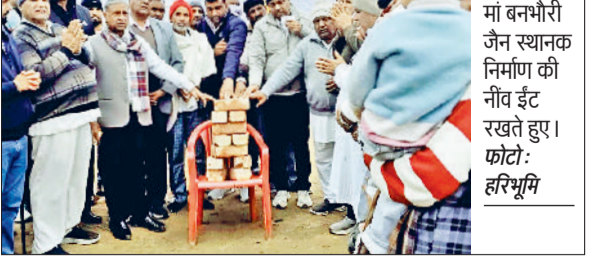
उचाना। बनभौरी में मां बनभौरी जैन स्थानक निर्माण की नींव ईंट रखते हुए।

जो ईसान सच्चे मन से भक्ति करता है उसके सारे कार्य सफल होते हैं। कहानी के माध्यम से बताया कि एक गुरु एवं उसके काफ़ी शिष्य थे। सभी शिष्य समझदार थे लेकिन एक शिष्य भोला था। भोला शिष्य गुरु को आकर बोला आपने सभी शिष्यों को मंत्र दे रखे, सारा ज्ञान दे रखा है ऐसे में उनके पास काफ़ी श्रद्धालुओं की भीड़ रहती है। मुझे भी मंत्र तो